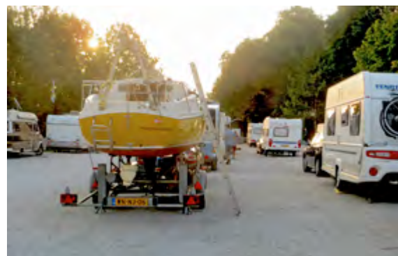
Vreemde eend in de bijt op doortrek-camping aan de A9 bij Greeding

ons eigendom. Met het inmiddels behaalde Klein Vaarbewijs I en II en het Basiscertificaat Marifonie moest het ICC voldoende zijn om buitengaats te gaan. In de meerweekse vakanties van 2007, 2009 en 2012 zeilden we door de Duitse Bocht en Noord-Oostzeekanaal