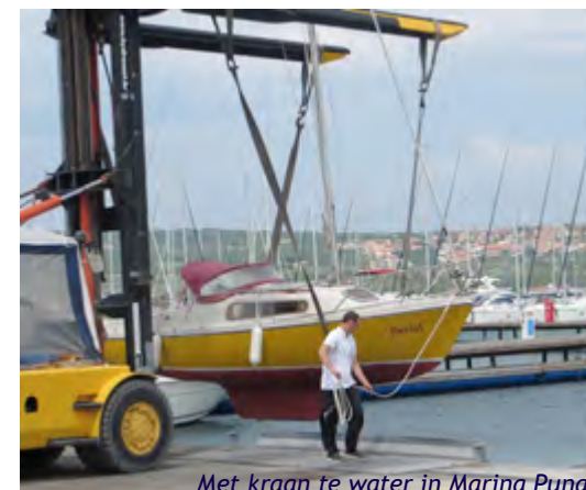
Met kraan te water in Marina Punat

In de winter 2014-2015 besluiten we in mei 2015 in Kroatië te gaan zeilen. We lezen ons in en kopen kaarten voor de Noord Adria. We hebben besloten voor een tewaterlating met een kraan van Marina Punat op het eiland Krk. Na het merendeel van de spullen, inclusief de buitenboordmotor, in de auto te hebben geladen, rijden we vanuit Hardenberg weg. In Greeding, vóór Ingolstadt aan de A9, overnachten we in de boot op een camping. Een boot op een trailer is een wat vreemde eend in de bijt op een doorgangscamping vol caravans en campers. De volgende dag rijden we vlot via München en Salzburg de A10 door Oostenrijk. Bij de Sloveense grens duiken we de Karawankentunnel in naar Ljubljana om vandaar de autoweg naar Rijeka te nemen. Hier nemen we de autoweg in de richting Split en slaan af