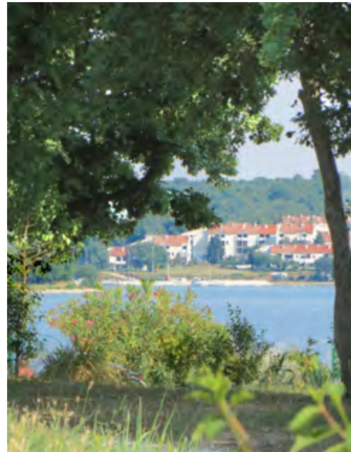
Na 30 jaar terug in Porec

De volgende morgen komt de havenmeester met de mededeling dat hij ons met een collega zal verleggen naar een meer beschutte plek vanwege een stormverwachting van 10 tot 12 bft. voor de komende twee dagen. Dit doet ons besluiten wat warmere spullen van de boot te halen en we vinden voor twee dagen een appartementje in het centrum van Baska.