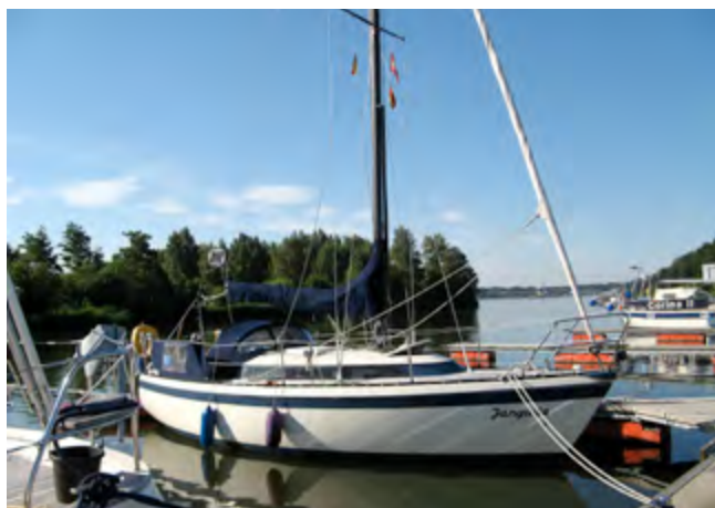
De Jangada in 2012 onderweg naar Denemarken)

We vinden op camping Pila in Punat stalling voor auto en trailer voor de komende drie weken (à € 5,- per nacht), waarmee ons avontuur in de Golf van Kvarner begint. Voor het jaarvignet om in Kroatië te mogen varen, kun je op zondag niet terecht bij de Kapetanija van Punat. Dus stappen we hier op maandagmorgen naartoe en betalen voor een jaar 662 Kuna (= € 88,-) inclusief drie weken toeristenbelasting. Omdat we voor een bootje van 6.50 meter een liggeld van € 28,- wel een fors bedrag vinden, verkassen we naar de gemeentehaven.