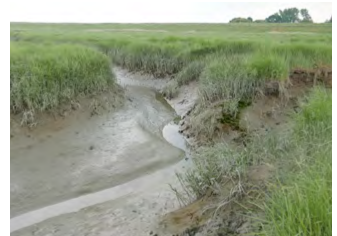
Land van Saeftinge