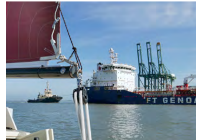
Schelde nabij Antwerpen