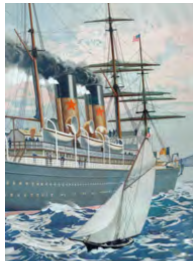
Detail red star poster

Doel voor de dag is Lillo. Een minuscuul vestingstadje, dat in vroeger tijden de toegang tot Antwerpen bewaakte. Een