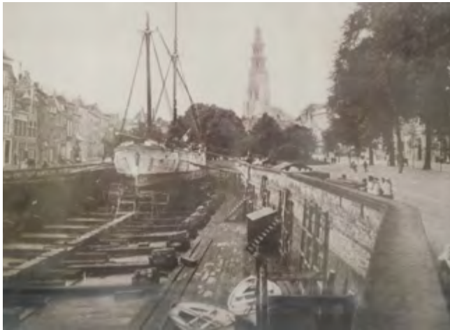
Middelburg, de Dam