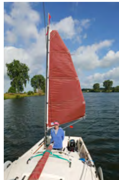
Op de Maas

te passeren. En het ANWB-handboek had moeite ons te adviseren. Of lag het aan ons? De brughogtes die de gele blokken op de pijlers aangaven weken nog al eens af. Ook werd niet altijd vermeld dat er sluizen zijn met een beperkte doorvaarthoogte. En onze marifoonoproepen werden niet beantwoord in tegenstelling tot die van de beroepsvaart. Aanleggen en op de knop drukken was voor ons het parool.